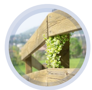
Disturbi dello Spettro Autistico