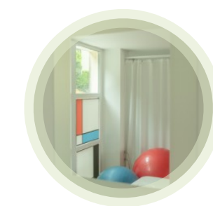
Servizi Educativi e Riabilitativi