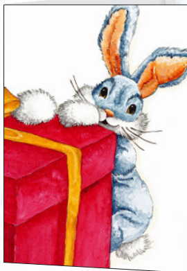
immagine di copertina