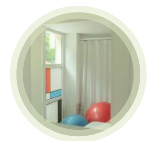
Servizi Educativi e Riabilitativi